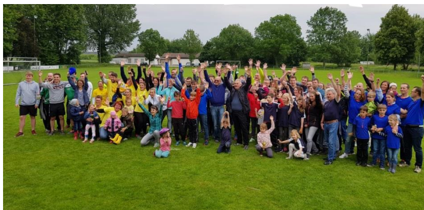
Abschlussfoto der Dorfolympiade mit allen Teilnehmern

Vielen Dank an die Mitwirkenden, die uns auf dem Spielfeld, auf dem Schießstand, an der Theke und in der Küche geholfen haben. Ohne Euch wäre diese gelungene Veranstaltung nicht möglich gewesen. DANKE.